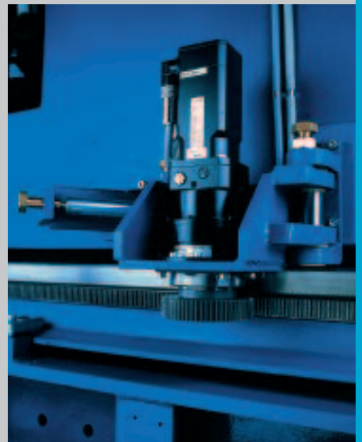
Luftgedertete doppelseitige Längsantriebe gewährleisten hohe Produktivität und Genauigkeit. Air sprung twin AC drive motors for increased productivity and accuracy.