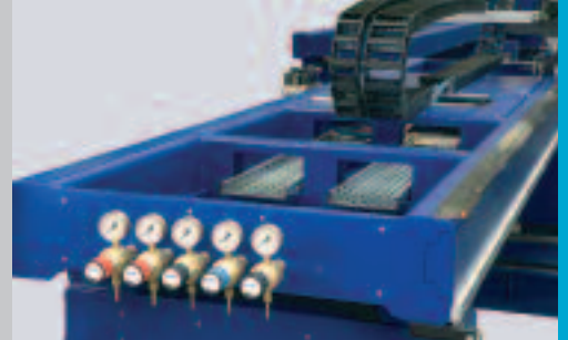
Portalbrücke mit Doppelsektions-Aufbau für hohe Steifigkeit und geringe Masse. Twin bridge design for high rigidity and low mass.